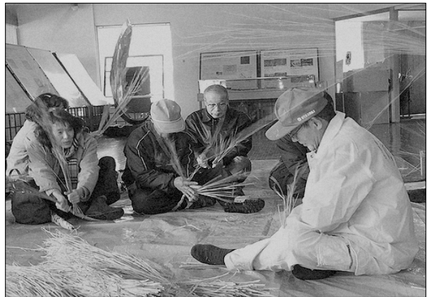
しめ縄・寄せ植え講習会 平成17年12月22日(木) 参加者13名

【受講者の声】 基本的に操作ができるようになった。 家に2台パソコンはあるが触れることがなかったけど初めて機械に触れることができ、良かった。