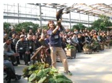
花鳥園の猛禽類の演