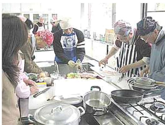
真剣な男の調理を向こうで見守る心配そうな顔