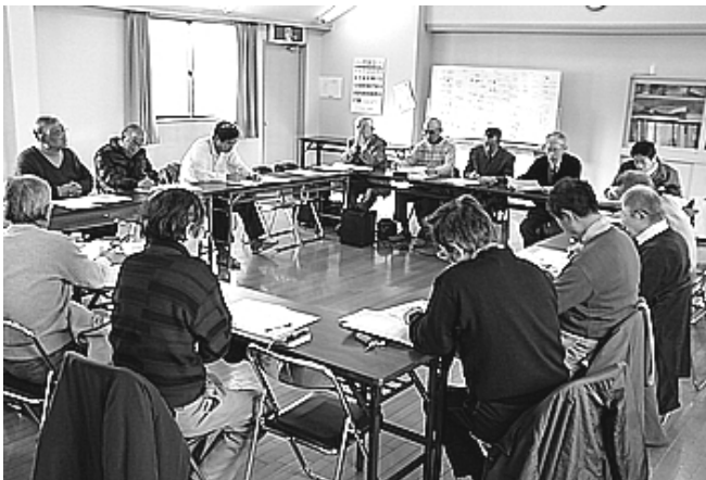
山田荘小学校区地域懇談会

また、年会費は平成22年度第2回通常総会において、金額1,200円を3,600円にするように承認されました。