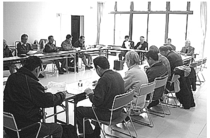
東光小学校区地域懇談会