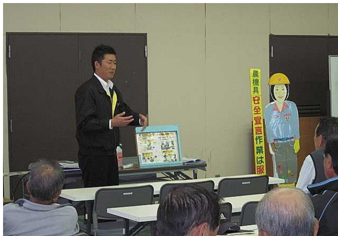
草刈機取扱とメンテナンス方法