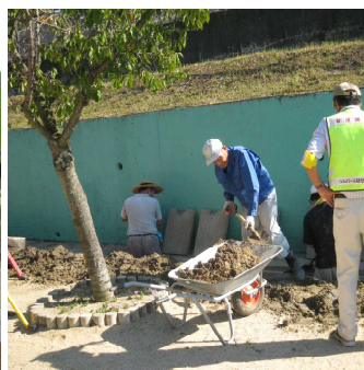
側溝土砂撤去作業