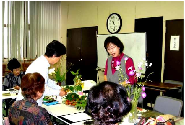
シルバー手芸教室のようす