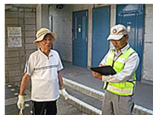
屋外清掃・フラッツ下狛