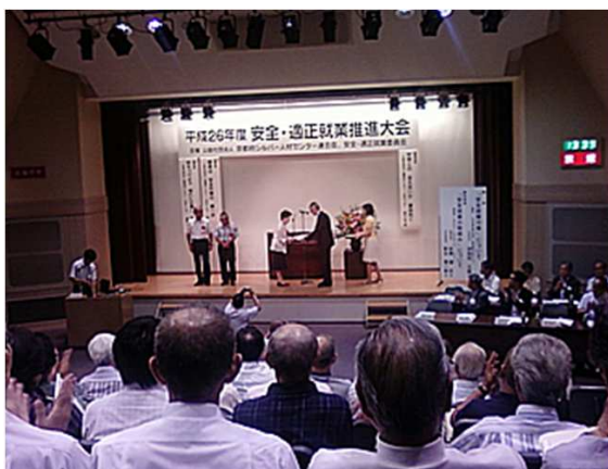
安全・適正就業推進大会 標語入選者表彰

7月29日(火)、京都府立総合社会福祉会館において、京都府シルバー人材センター連合会主催の平成26年度安全・適正就業推進大会が開催され、当シルバーからは安全・適正就業委員会担当理事、同委員、職員の計6名が出席しました。