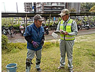
植栽管理・精華町役場