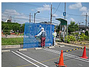
除草(機械刈)・ガーデンシティ