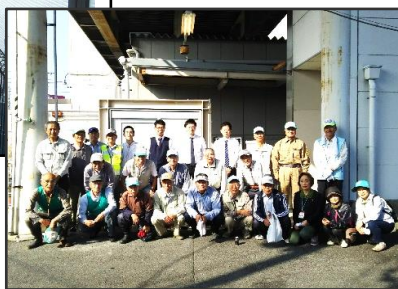
昨年の清掃ボランティアのようす 開始前の準備