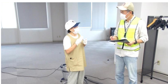
屋内清掃・民間企業