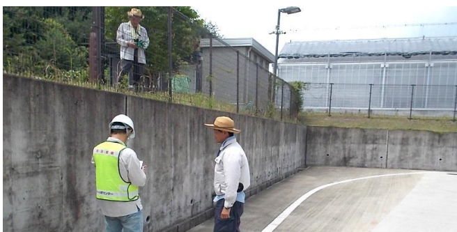
除草、集草・民間企業