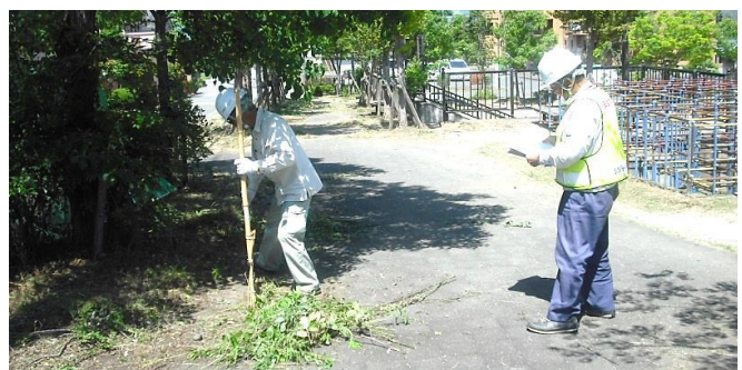
除草・精華台三丁目、あかり公園