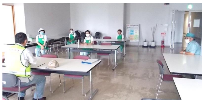
屋内清掃・精華町役場