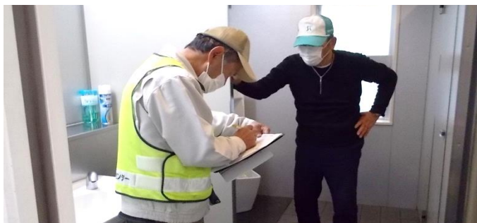
屋内清掃 一般企業内