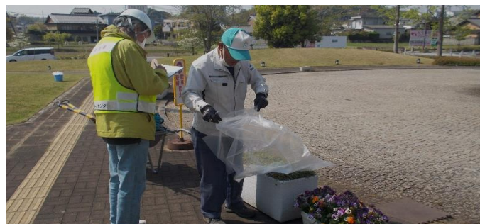
植栽管理・除草 精華町役場