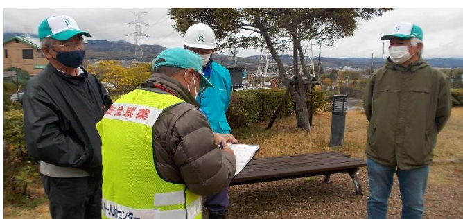
公園遊具点検 畑ノ前公園